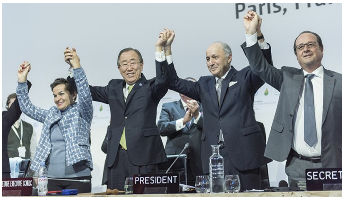
Det var jubel for den nye klimaavtalen under avslutningsseremonien for klimaforhandlingene i Paris.

Parisavtalen skal styrke den globale responsen på klimautfordringene ved å redusere utslipp av klimagasser og styrke arbeidet med klimatilpasning.