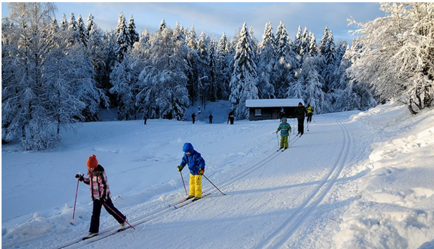
Marka er viktig for at folk i alle aldersgrupper skal ha muligheter til å drive fysisk aktivitet. Bildet er fra Linderudkollen i Oslo.