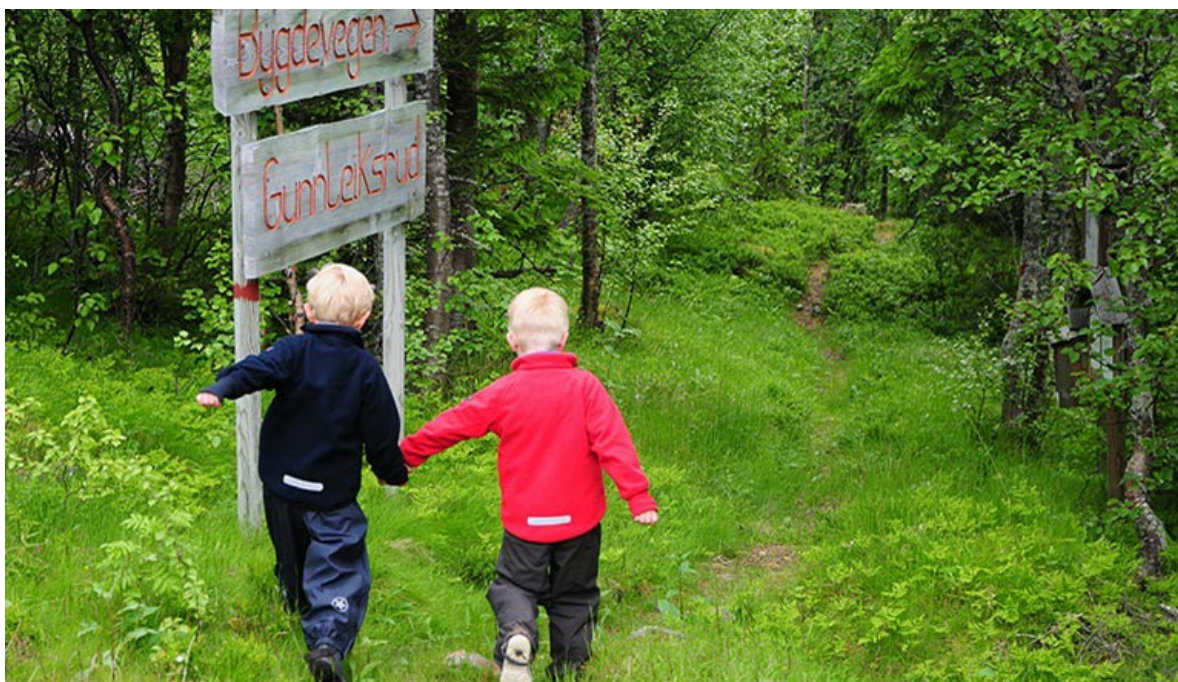
Skilting kan gjøre det lettere å legge ut på tur.