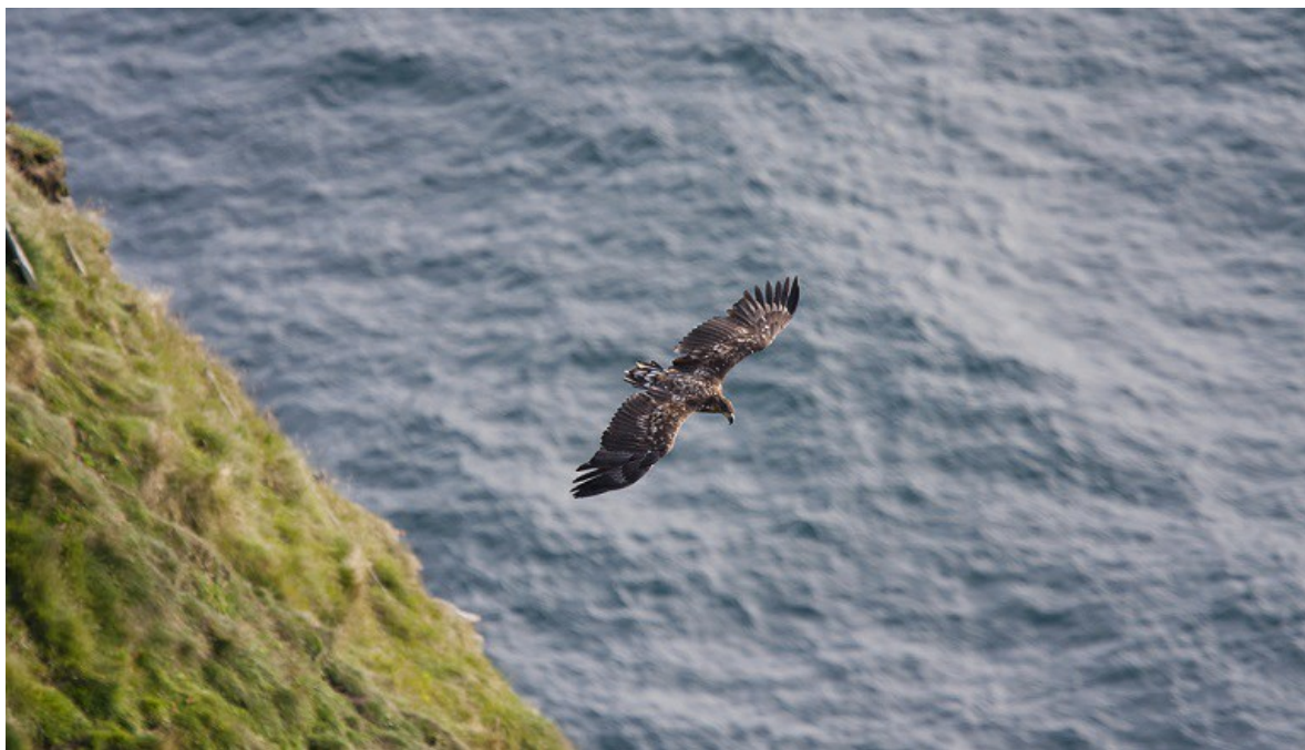
Havørn står oppført på Bonnkonvensjonens liste I.